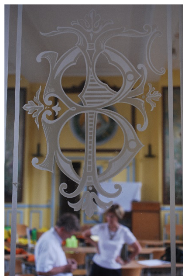
Années 1910 le restaurant devenu foyer des étudiants, puis salle de classe en 2008